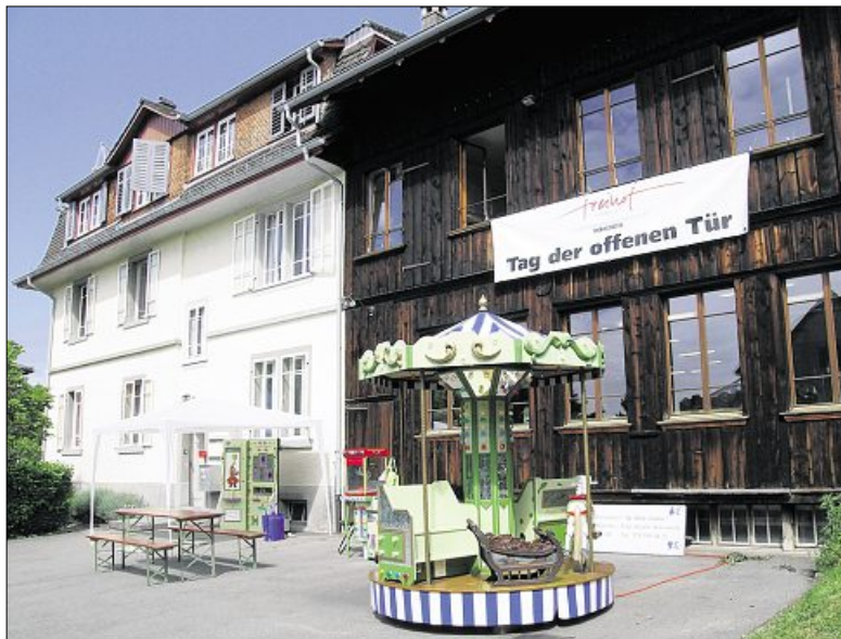
Der Freihofer hat durch sein gelungenes Jubiläumsfest einen noch grösseren Bekanntheitsgrad erreicht. (Ruth Weber)