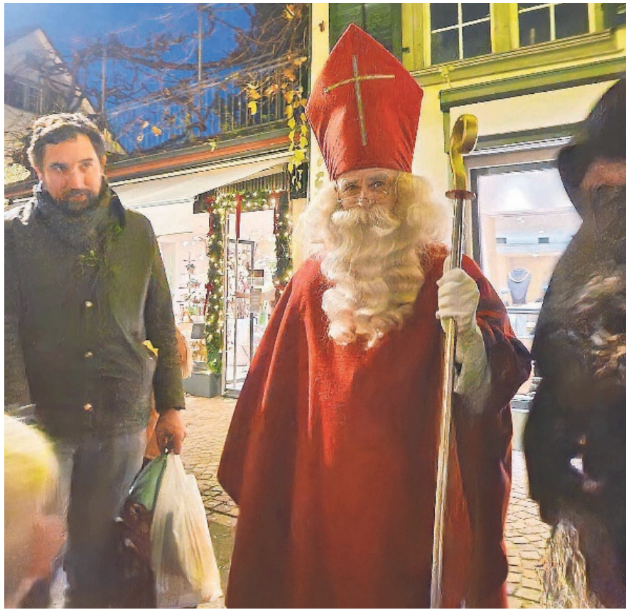
Der Samichlaus wartet auf die Sprüchli der Kinder – auch die Erwachsenen dürfen vorsprechen.

bot luden zum Verweilen und Geniessen ein. Das Einkaufen kam bei dieser enormen Produktauswahl keinesfalls zu kurz. Insbesondere Essbares war gefragt und fand einen guten Absatz. Die Christmas Singers sorgten mit ihren weihnachtlichen Liedern auch dieses Jahr für Vorfreude auf die anstehende Weihnachtszeit. Sogar der Samichlaus wurde auf der Dorfstrasse gesichtet und erfreute manches Kinderherz. Rundum ein gelungener Anlass, welcher zu vielen Begegnungen führte und sich wohlthuend auf das dörfliche Leben auswirkt.