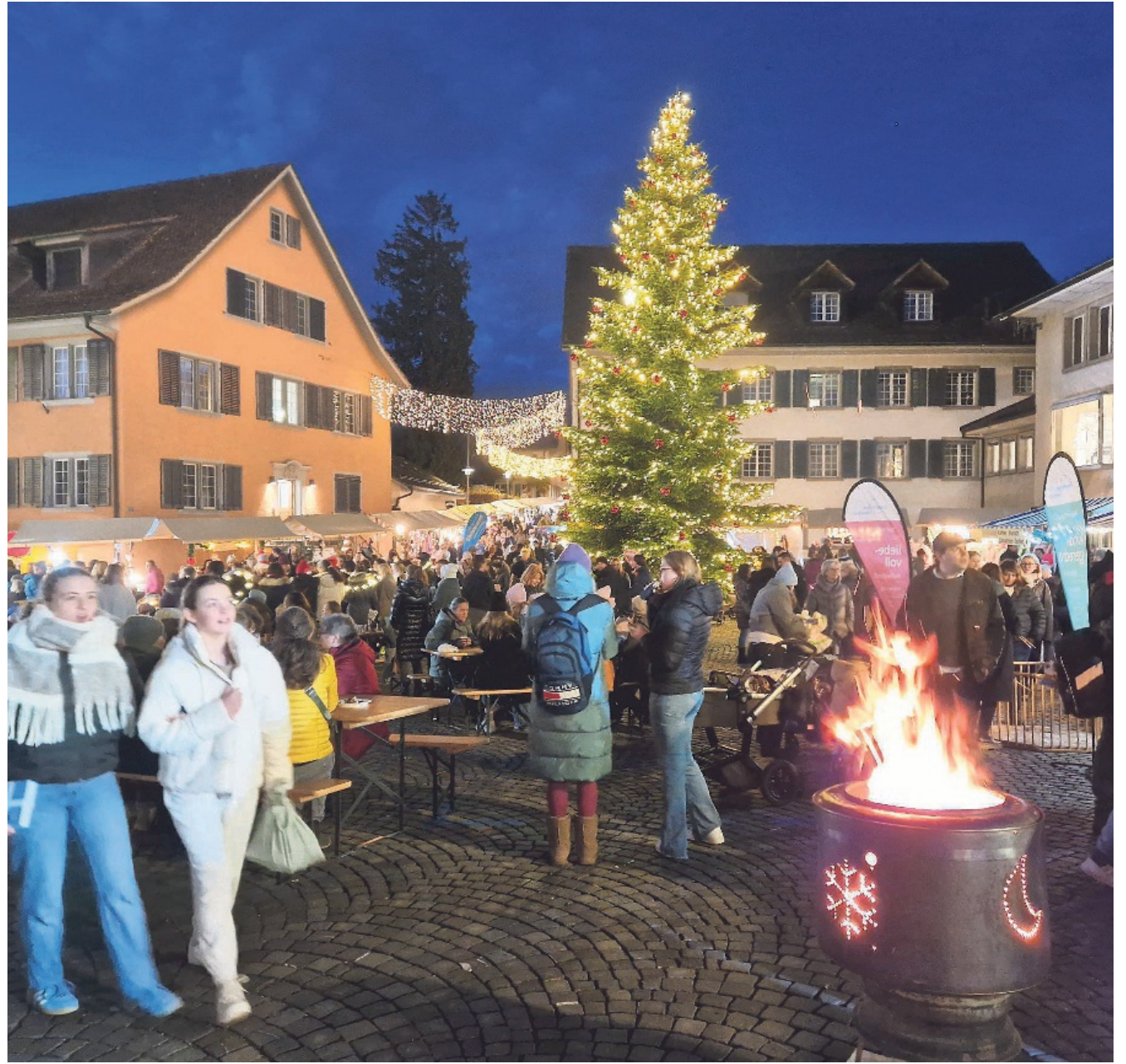
Stimmungsvolle Atmosphäre auf dem Dorfplatz vor dem Gemeindehaus. Wie immer ist die Tanne reich geschmückt.