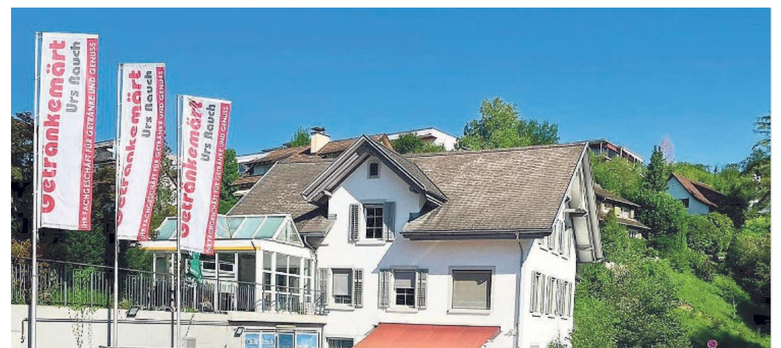
Den Kunden von E. Freitag Wein- & Getränkehandlung AG wird weiterhin ein Topservice gewährleistet.